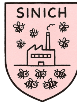
Das Ergebnis kann sich sehen lassen!

Und eines ist sicher: Wenn sogar jedes Kuhdorf in Südtirol sein eigenes Wappen besitzt, spätestens seit Kuens seines stolz präsentiert, dann wird es höchste Zeit, dass auch Sinich sein eigenes bekommt. Also haben wir uns der Herausforderung gestellt und den Mut gefasst, das Wesentliche von Sinich in einem einzigen Wappen festzuhalten. Unsere Grafikerin hat monatelang mit voller Hingabe daran gearbeitet.