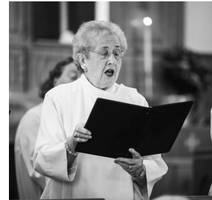
In Sinich sind sogar die Ältesten auf dem neusten Stand!

🎵 Stille Nacht, Frost erwacht, Bus delayed, wie immer halt. Alle frieren, doch keiner low-key, weil jemand shoutet: „Yo, Glühwein, no cap, see?“ Sinich voll Winter-Vibes, Sinich voll Winter-Vibes.