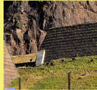
Das Weihnachtsmenü ist gerettet!

Denn wer in Sinich nur einen Blick aus dem Fenster wirft und eine Gams oder ein anderen Vierbeiner trifft, der weiß: Heute Abend wird's nicht nur gut, sondern lecker.